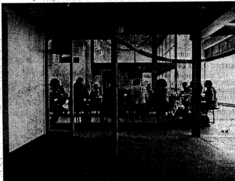
Mardi, les membres de la FEA avaient occupé les anciens locaux de La Suisse, dans l'espoir de convaincre les autorités.